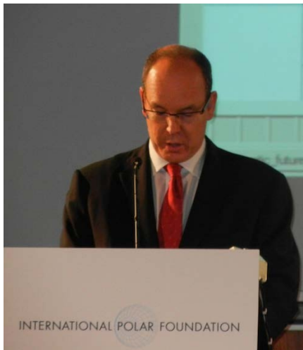
Prins Albert II af Monaco Issittup Siunissaa pillugu Ataatsimeersuarnermut 2011-mi tikilluaqqusisoq

TIKERAARNERIT, AALISARNEQ PILLUGU ISUMAQATIGIINNIARNERIT, ISSITTUP SIUNISSAA PILLUGU ATAATSIMEERSUARNEQ, PWP-MI ATAATSIMIINNERIT INGERLATAQARTULLU NUTAAT.