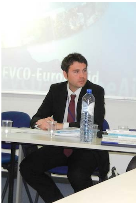
Jacob Isbothesen Bruxellesimi Kalaallit Nunaata Aallartitaqarfianeersoq PWP 3-mi, Avatangiisit, Silap Pissusaata Allanngornera, Pinngortitami Ajunaarnersuit Pitsaaliorneri Aqutsinermilu siulittaasup aappaa, Bruxellesimi ulloq 14. oktober

Global Climate Change Alliance (GCCA) tassaavoq EU-mit aningaasalersorneqartoq oqallittarfik silap pissusaata allanngornera naleqqussarnerlu pillugit ataatsimiinnernik aaqqissuussisarpoq, nutaatullu OLT-mi nunat GCCA-mi peqataasinnaalersimallutik. Nunat ataasiakkaat pisariaqartitaannut soqutigisaannullu naleqqussarneqarsimasunik aaqqissuunneqarsimasunik ataatsimiinnernik GCCA pilersuisinnaavoq. OLT-it peqatigalugit 2012-mi januarip naanerani OLT-EU-p ukiumoortumik katersuunnerisa nanginneratut immikkut GCCA-mi ataatsimiinnissaq aaqqissuunneqarpoq. OLT-mi silap pissusaanik aamma aningaasaqarnikkut ilisimasaqartut inuit ataatsimiinnermi peqataasussat naatsorsuutigineqarpoq, tassa ataatsimiinnermi silap pissusaa, avatangiisinut pitsaasumik siuariartorneq, aningaasalersuineq il.il. sammineqartussaapput.