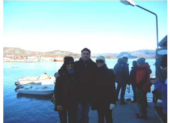
Sulisut nutaat Ilulissani Aalisarneq pillugu isumaqatigiinniarnernut atatillugu Oqaatsuniittut.