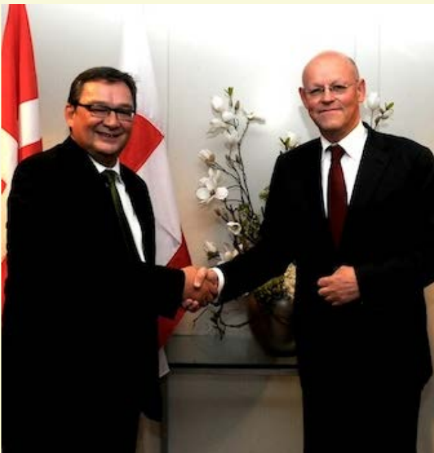
Kuupik Kleist aamma nunanut allanut ministeri Uri Rosenthal

Kalaallit Nunaannit aallartitat ataqqiniarlugit WWF nerersuartitsivoq, tassani hollandimi sinniisut upernaq Kalaallit Nunaannut tikeraarsimasut aamma peqataallutik. Taakku akornanniippoq hollandimi Kunngissaq Willem-Alexander. Tikeraarnerup nalaani Hollandip aamma Kalaallit Nunaata akornanni qaninnerusumik attaveqatigiinnerit annertusarneqarput, siunissamut iluaqutaasumik naammassinnittumillu suleqatigiinnissamut periarfissiisoq. 2012-p naalernerani Kalaallit Nunaannut tikeraartoqaqqinnissaa naatsorsuutigineqarpoq