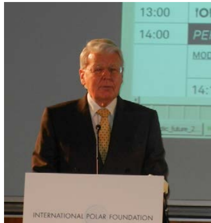
Islands Præsident Ólafur Ragnar Grímsson