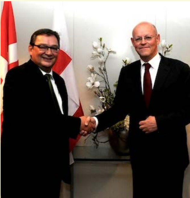
Kuupik Kleist og udenrigsminister Uri Rosenthal

WWF afholdte en middag til ære for den Grønlandske delegation, hvor de hollandske repræsentanter der besøgte Grønland i foråret også deltog. Heriblandt den hollandsk Kronprins Willem-Alexander. Tætte bånd mellem Holland og Grønland blev udviklet under besøget, med mulighed for et konstruktivt og fyldestgørende samarbejde i fremtiden. Der forventes allerede et opfølgingsbesøg i Grønland ultimo 2012.