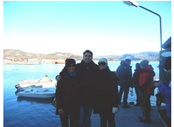
Det nye hold i Oqaatsut i forbindelse med Fiskeriforhandlingerne i Ilulissat, Grønland.