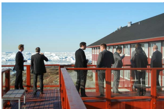
Delegationerne nyder udsigten over Ilulissat Isfjord under en pause i Fiskeriforhandlingerne.