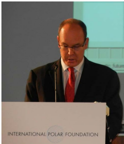
Prins Albert II af Monaco byder velkommen til Arctic Futures Symposium 2011

BESØG I HOLLAND, FISKERIFORHANDLINGER, ARCTIC FUTURES SYMPOSIUM, PWP MØDER OG NYT HOLD.