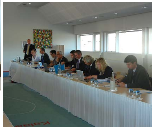
EUs delegation til Fiskeriforhandlingerne på Hotel Arctic i Ilulissat.